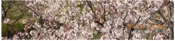
4.02 現地気温AM・19度・晴れ・8分咲き 日中暖か