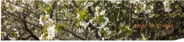
4 2 現地気温AM・19度・晴れ・7分咲き 日中暖か