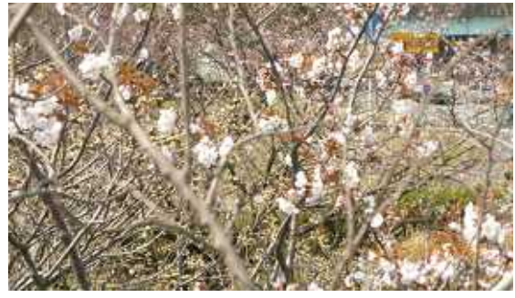
3.31 | 現地気温AM・22度・晴れ・6分咲き 風強く暖か