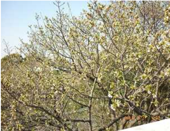
3 | 31 | 現地気温AM・23度・晴れ・6分咲き 風強く暖か