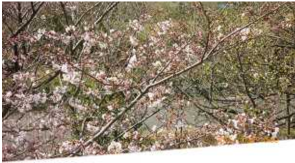
3 | 31 | 現地気温AM・22度・晴れ・5分咲き 風強く暖か